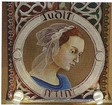
Vista frontal de les pintures al voltant de l'altar.